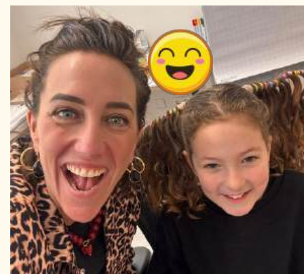
1 april: gekke haren dag