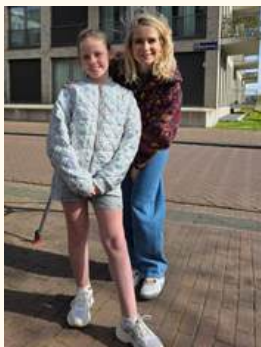
Opnames van het Klokhuis in 7/8B