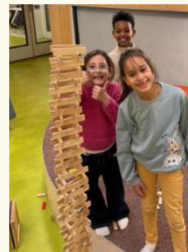
Een bouwwerk maken samen in 3/4D